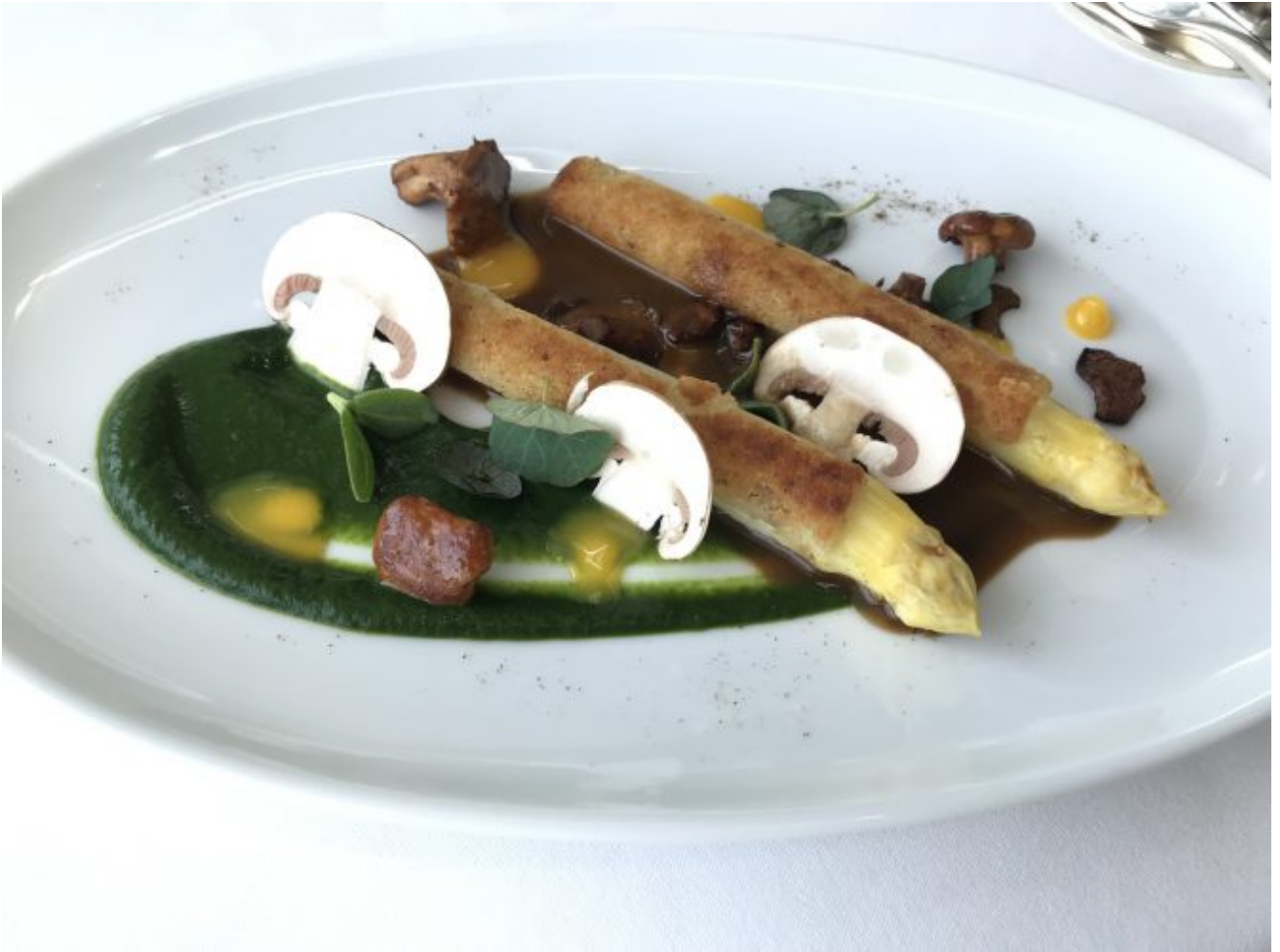
Asperges blanches, cresson et champignons Sylvestre