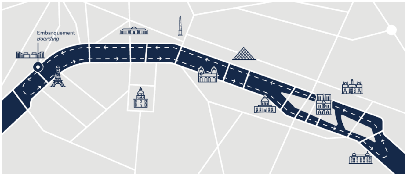
Le parcours de Ducasse Sur Seine