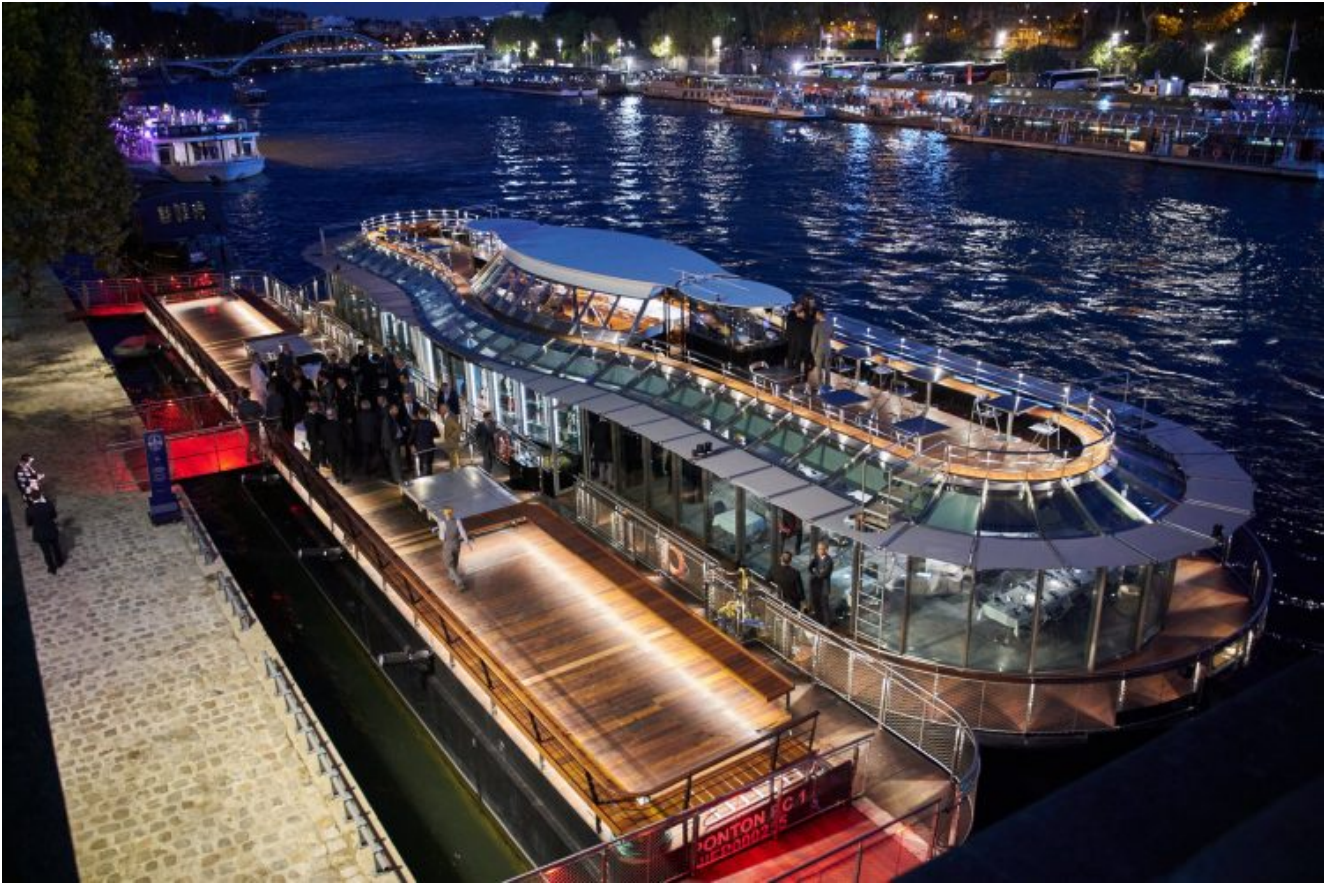
Sous le ponton, les zones de stockages, frigos et vestiaires