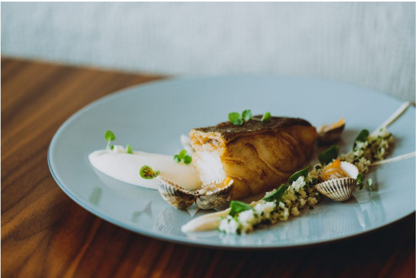
Cabillaud rôti, chou fleur cordifole