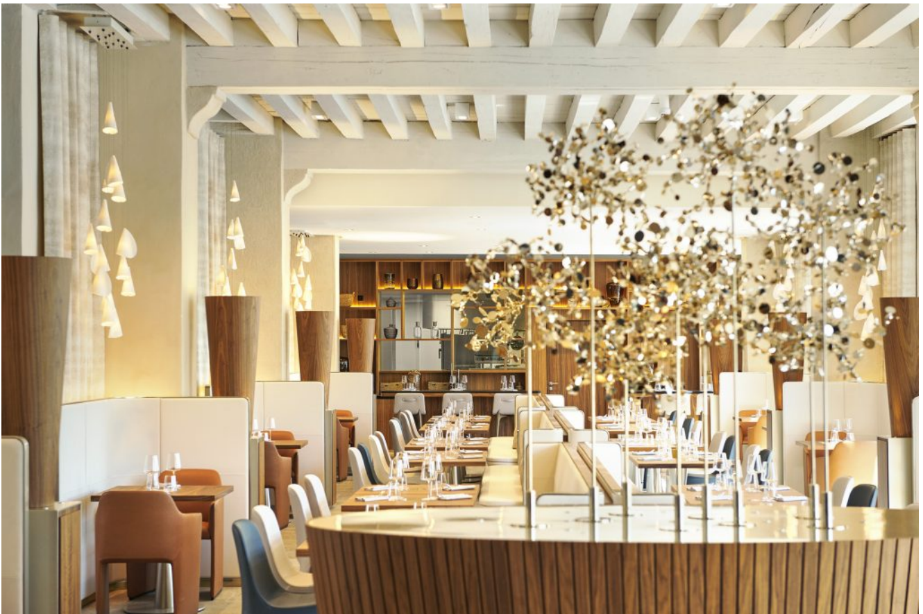
Restaurant Epona

Situé au rez-de-chaussée de l'InterContinental Lyon - Hôtel-Dieu, le restaurant tire son nom d'une déesse très populaire de la mythologie celtique gauloise, patronne des cavaliers et des voyages.