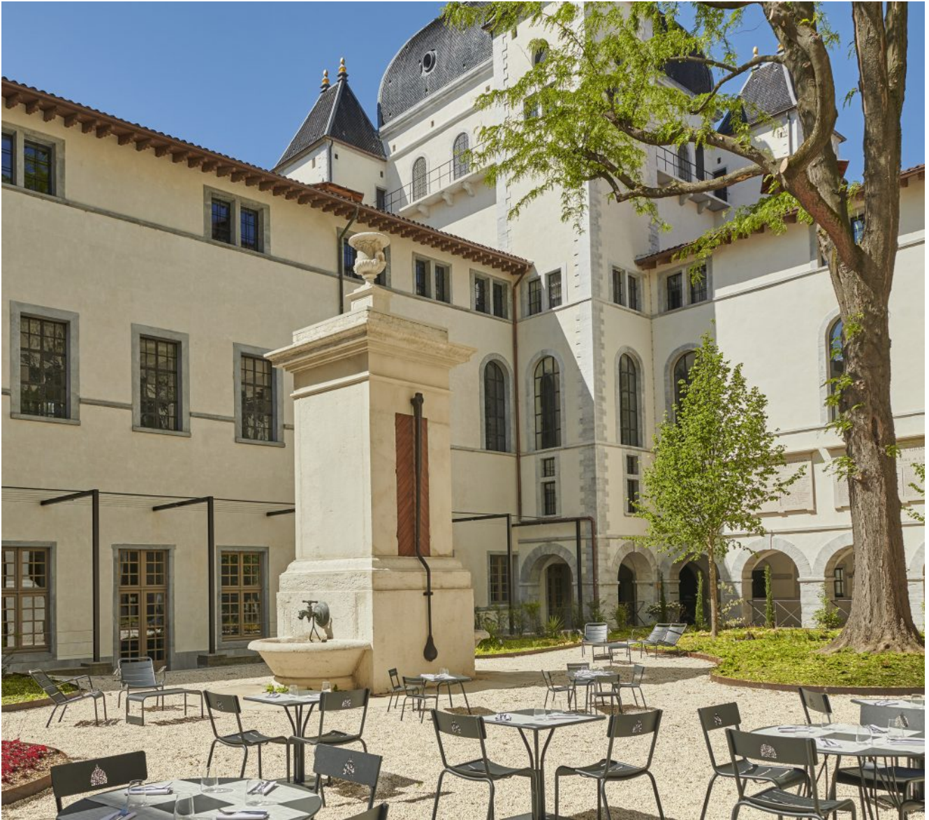
Restaurant Epona