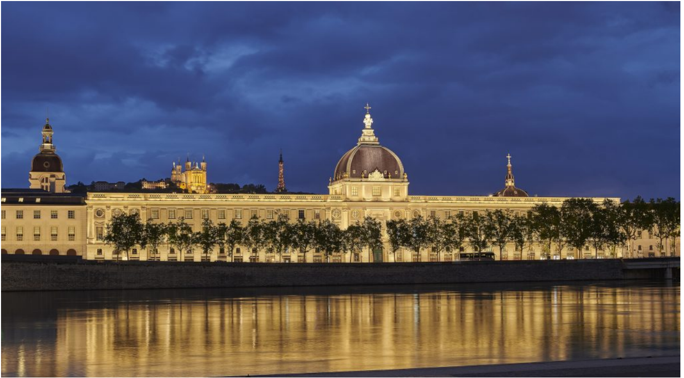
InterContinental Lyon - Hôtel-Dieu