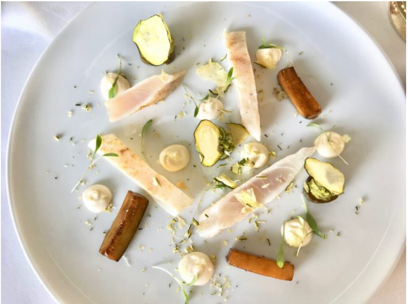
Daurade royale rafraichie, concombre et courgette acidulée

Le menu (3 plats avec des choix) est annoncé dès la réservation ; 100€/personne hors boisson ou 150€ toutes boissons comprises. Un clé en main.