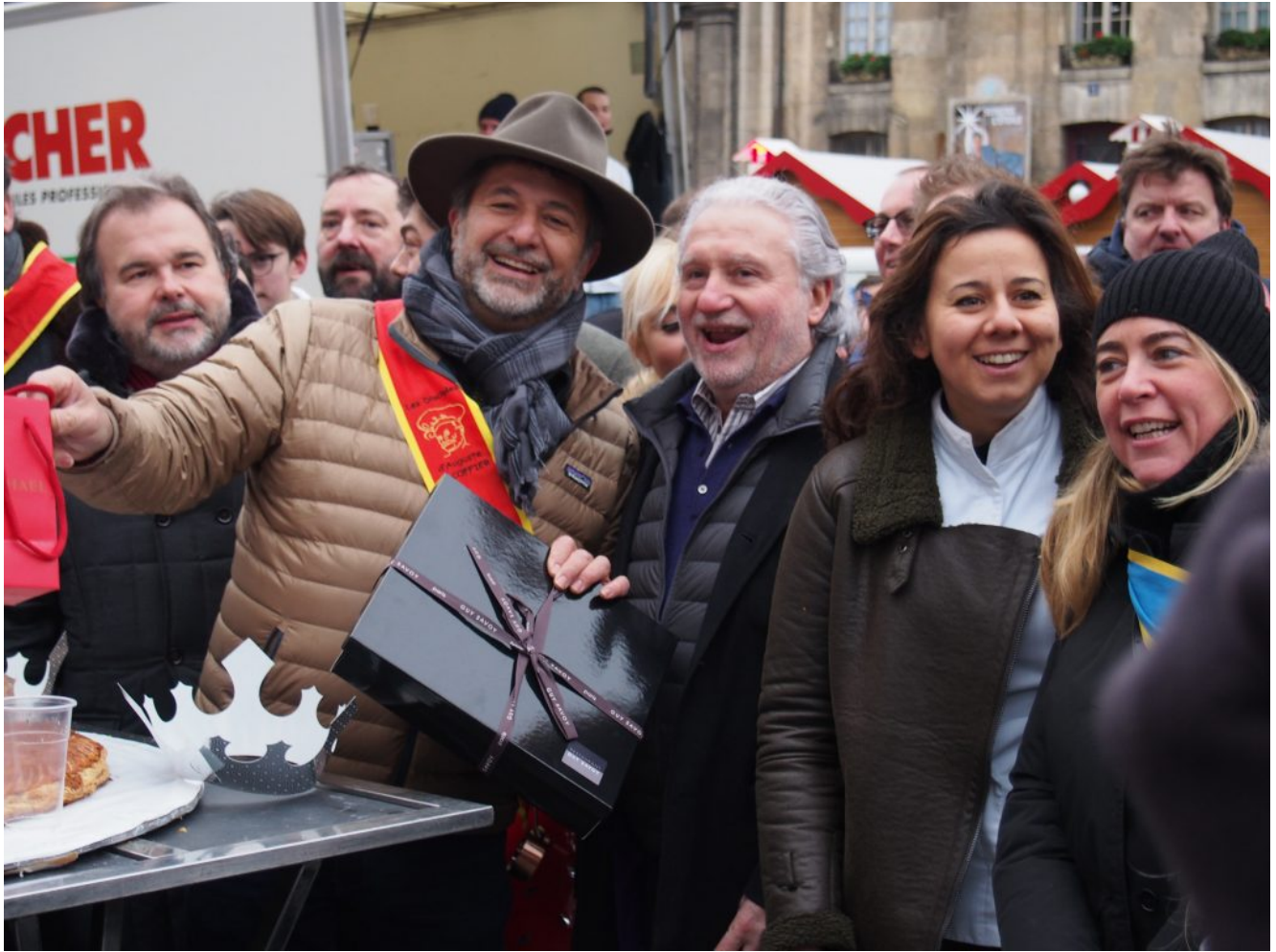
La Galette des chefs organisée par les Disciples d'Escoffier Paris